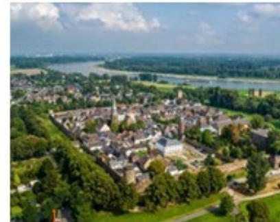
© AG Ockenk, KATZ, Schenkman, 19700 AG